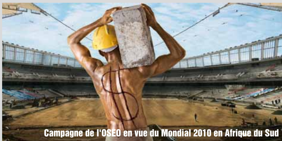
Campagne de l'OSEO en vue du Mondial 2010 en Afrique du Sud

● 115 communes achètent équitable. ● 2481 communes tolèrent un risque d'exploitation.